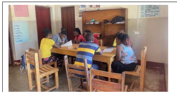
Reunión de los trabajadores del hogar

1 jardinero que cultiva verduras y cuida la porqueriza del Hogar