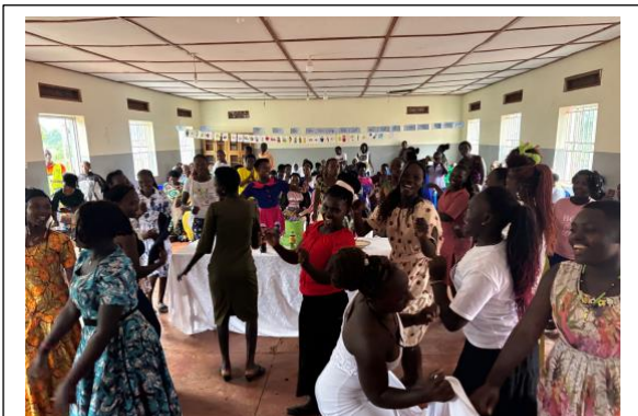
Jóvenes felices en la celebración de fin de curso