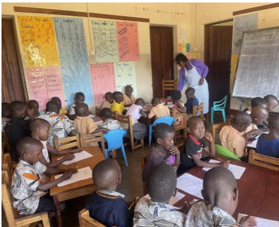
Niños en 1º de primaria

También estamos trabajando en reubicar a los niños en la comunidad, dándoles prioridad a sus propias familias cuando es posible, y en caso contrario, colocándolos en familias de acogida.