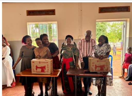
Dos de los jóvenes con sus máquinas de coser.