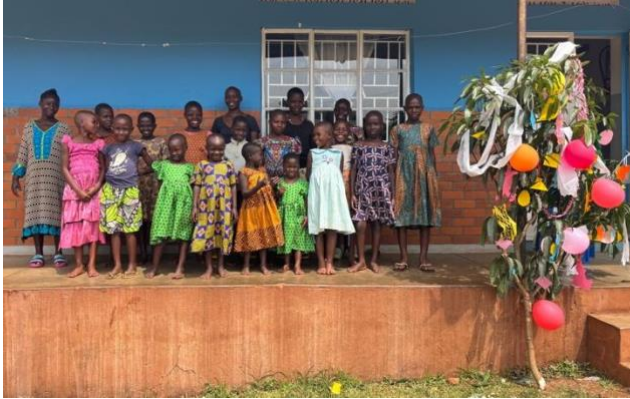
Los niños de una de las casas del hogar con su árbol de navidad.

OTCH está funcionando bien; todos los trabajadores son cooperativos, responsables y dedicados, especialmente en el cuidado de los niños. Todos los niños están sanos y felices, y están aprendiendo a convertirse en ciudadanos responsables de Uganda.